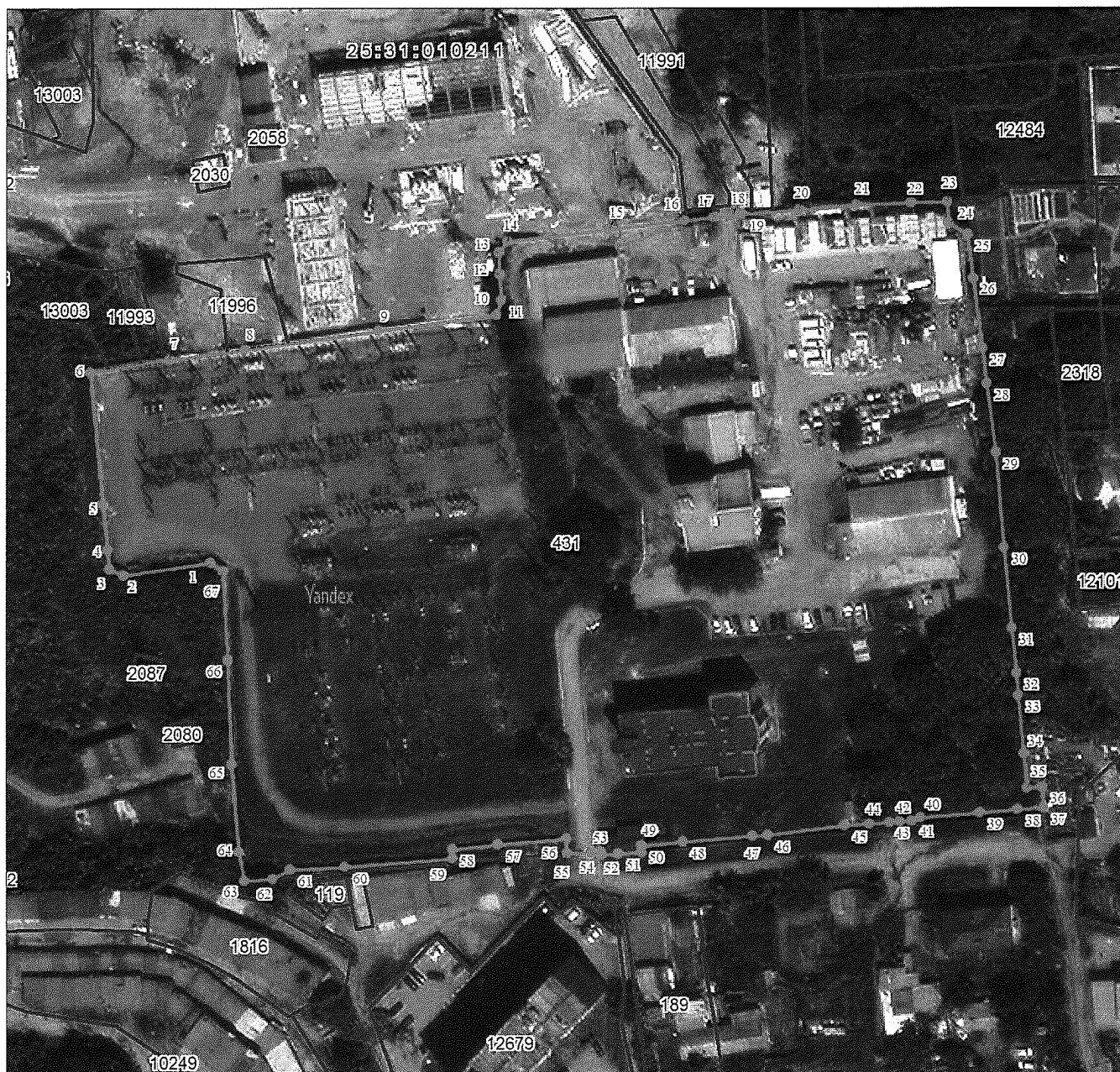
СХЕМА РАСПОЛОЖЕНИЯ ГРАНИЦ ПУБЛИЧНОГО СЕРВИТУТА объекта электросетевого хозяйства ПС 110 "Находка"